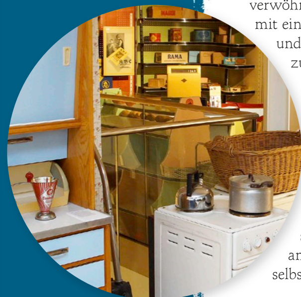
Foto: Sonderausstellung im Winter 2021/2022

zwischen dem 5. Mai und dem 8. Oktober '23, jeweils von Freitag bis Sonntag