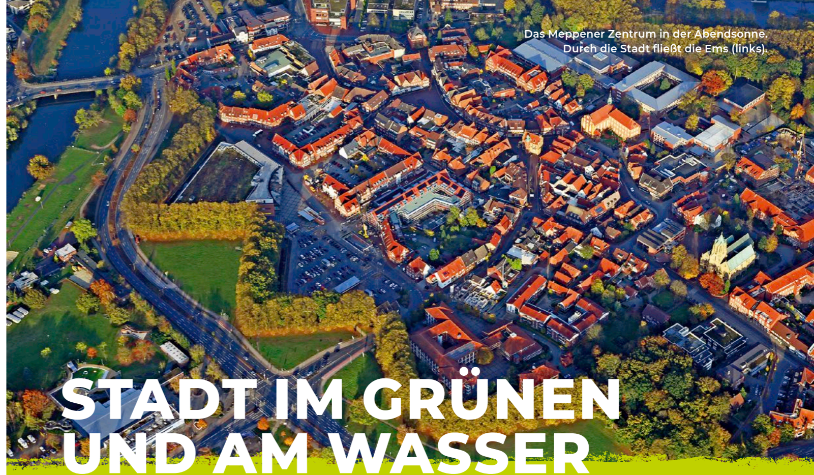
Das Meppener Zentrum in der Abendsonne. Durch die Stadt fließt die Ems (links).